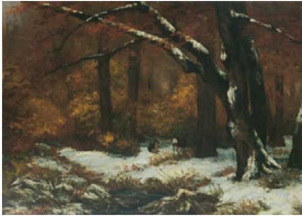
Remise de chevreuils huile sur toile, 58,5 x 80,5 cm, sans date, Dole, musée des Beaux Arts.