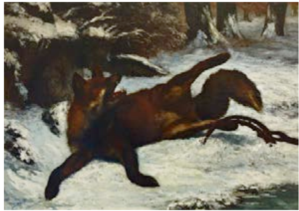
Le renard pris au piège vers 1860, huile sur toile, 125 x 144 cm, Ornans, musée Courbet.

À partir de 1866, Gustave Courbet commence une série Remise de chevreuil* prétexte à représenter différents paysages des environs d'Ornans. L'exposition présente quatre tableaux et une eau-forte sur ce même sujet. De petites dimensions, elles sont destinées aux collectionneurs plus modestes et pour un marché diversifié. Dans un sous-bois trois chevreuils ont trouvé un lieu à l'écart des hommes. Deux sont lovés dans l'ombre du talus, tandis qu'un troisième au centre est aux aguets. Il se détache sur la neige et conduit le regard vers les profondeurs des sous-bois, accompagné par le sentier tracé dans la neige bordé d'arbres. Les deux chevreuils abrités par le talus ne sont pas visibles au premier regard malgré leur emplacement au premier plan, protégés par l'ombre et par le chevreuil placé au centre qui attire l'œil.