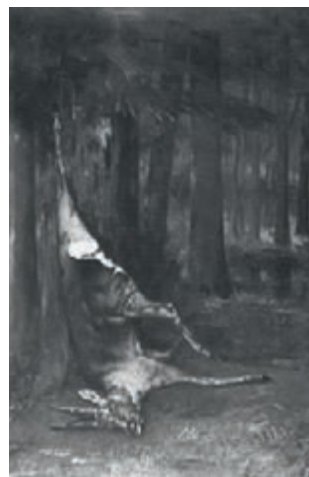
Le Chevreuil mort 1858, huile sur toile, La Haye, musée Mesdag