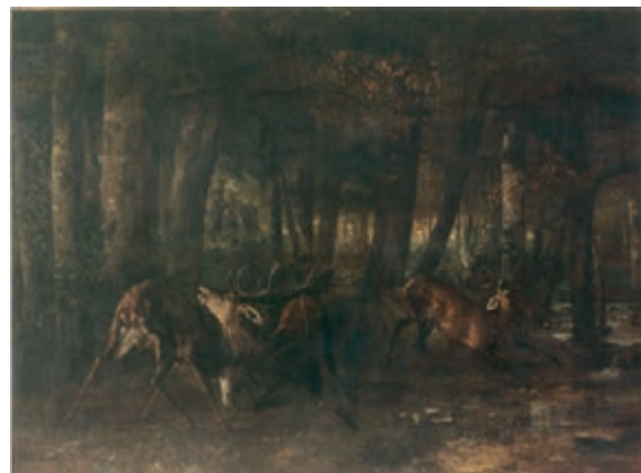
Le Rut de printemps ou Combat de cerfs , 1861, huile sur toile, 355 x 507 cm, Paris, Musée d'Orsay

1857 et Le Rut du printemps en 1861, L'Hallali en 1867 sont moins provocateurs, mais rapportent beaucoup à Courbet en devenant le point de mire des expositions nationales comme internationales, (cf. étude de documents : les grands formats). Une vingtaine d'œuvres qui caractérisent sa carrière alors que le catalogue raisonné en compte plus d'un millier. Les petites toiles sont vendables et paient les plus grandes. Elles sont présentées et vendues pour la plupart à une nouvelle classe de collectionneurs méprisant le Salon 25 .