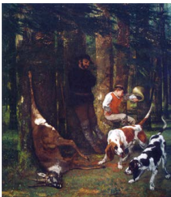
La Curée, chasse aux chevreuils dans les forêts du Grand Jura 1857, huile sur toile, 210 X 180 cm, Boston, museum of Fine Arts Réplique présentée dans l'exposition «L'Hallali ou la Curée» 1856-1862, huile sur toile, 56 x 44 cm, collection privée.