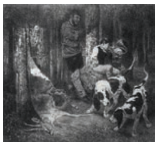
La Curée , lithographie parue dans l'Artiste du 18 juillet, 1858, in Van Gogh Museum Journal , 1999.