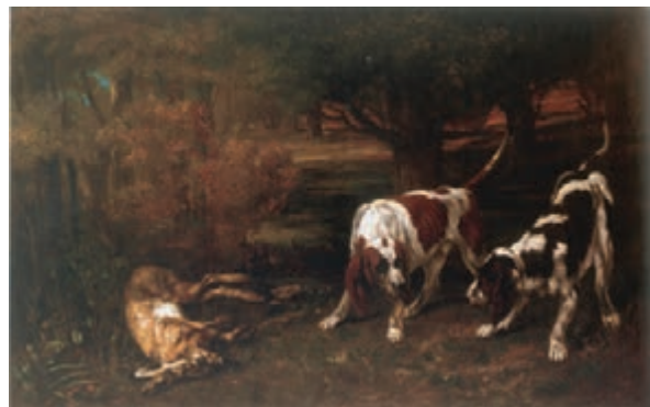
Chiens de chasse 1858, New York, Metropolitan Museum of Art,

Adossé contre un arbre, en une pose qui fait écho à l'animal mort, l'artiste s'est représenté. Cette méditation sur la vie et la mort, qu'appelle inévitablement la représentation de la chasse, est également un autoportrait. Gustave Courbet est chasseur mais aussi proie, mise en scène dans une confusion de rôle et qui