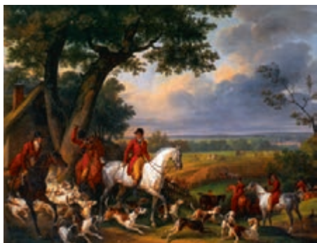
Carle Vernet, Le départ pour la chasse 1824, huile sur toile, 100 x 130 cm, Paris, musée de la Chasse et de la Nature, dépôt du musée du Louvre

Le renouveau de la grande vénerie* requiert l'usage du cheval. Le sportman anglais, qui pratique les sports équestres, est le type social de référence pour la plupart des propriétaires terriens. Le départ pour la chasse, les portraits collectifs entourés de la meute* de chiens ou groupés de l'équipage, les rendez vous de chasse sont autant de sujets témoignant d'un cérémonial ravivé. « Rien ne peut se faire simplement chez les gens qui montent d'un étage social à l'autre... » 2 . À l'époque de Courbet les représentations cynégétiques sont surtout celles de chasses à courre. Les tableaux sont présents dans la plupart des salons.