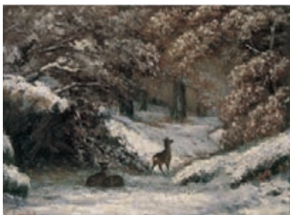
Remise de chevreuils en hiver 1866, huile sur toile, 54 x 72 cm, Lyon, Musée des Beaux Arts.

Situé au premier plan il est pourtant d'une taille trop importante par rapport au talus. Le paysage se déroule entre les troncs d'arbres qui, par leur réduction, propose une profondeur bloquée. Là aussi nous retrouvons cette perspective inversée ou d'expérience qui installe un va et vient entre la marche du promeneur et le motif, entre la proche et le lointain.