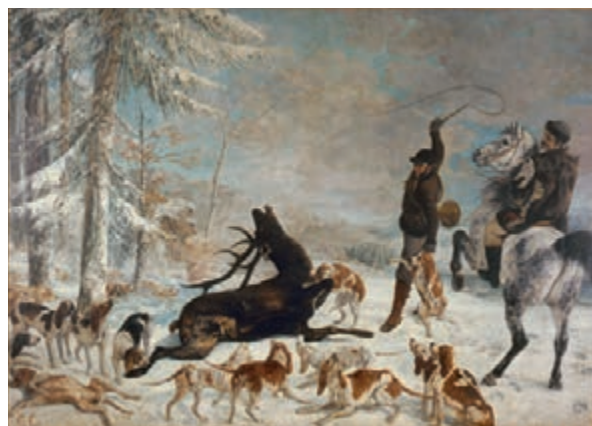
L'Halali du cerf 1867, huile sur toile, 355 x 505 cm, Besançon, musée des Beaux Arts. (reproduction)