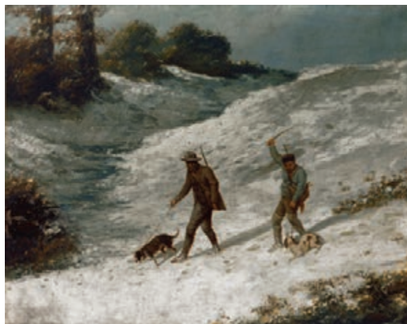
Braconniers dans la neige 1867, huile sur toile, 92 x 107 cm, Besançon Musée des Beaux Arts.

Courbet décrit longuement l'origine des représentations. Il insiste sur la fidélité à la nature de ce combat qu'il aurait observé en Allemagne. « J'ai vu ces combats dans les parcs réservés de Hombourg et de Wiesbaden [...] Je suis exactement sûr de cette action. Chez ces animaux il n'y a aucun muscle apparent. Le combat est froid, la rage profonde, les coups sont terribles [...] Ils n'ont pas pour un liard d'idéal. » 32